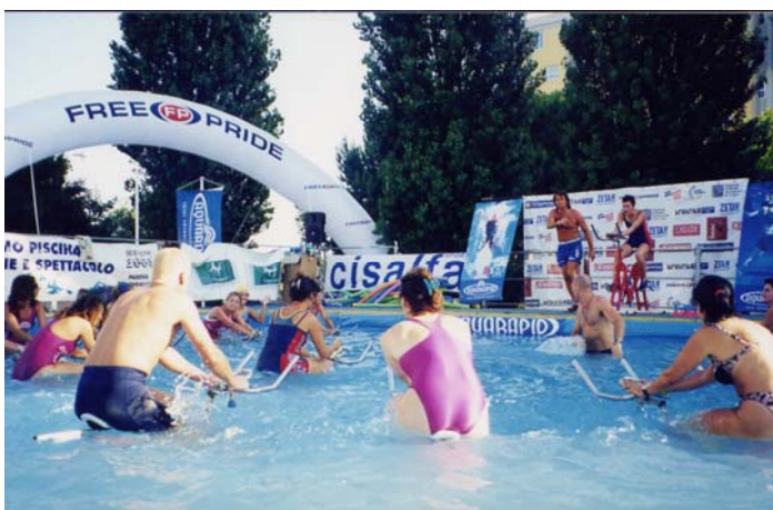
2000 Festiva del Fitness La prima "uscita in pubblico"