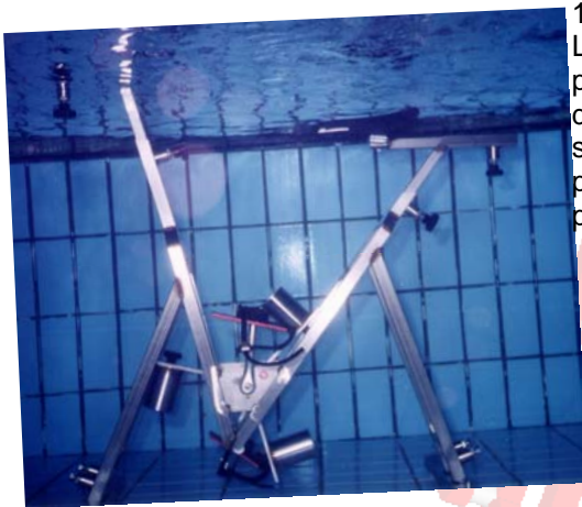
1999 L'hydrobike nella sua prima prova in versione quasi definitiva. Le resistenze sono ancora n acciaio e le pedane per l'appoggio del piede sono ancora dei