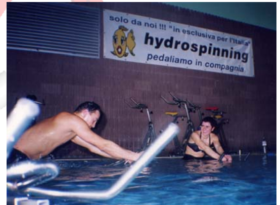
2000 Gennaio 2000 iniziano le lezioni di hydrospinning all'aquatic center di montichiari