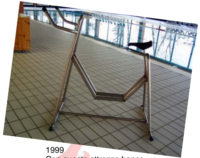
1999 Con questo attrezzo banco di prova sono state studiate tutte varianti sulla posizione del meccanismo e sulla forma delle resistenze (bicchieri)