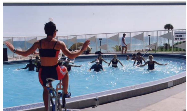
2000 miami La prima "uscita internazionale"